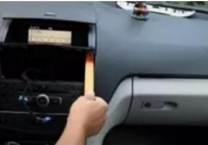
7. Hebeln Sie den Original-Fahrzeugbildschirm ab