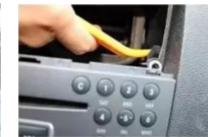
11. Hebeln Sie den CD-Befestigungsstapel des Originalfahrzeugs ab