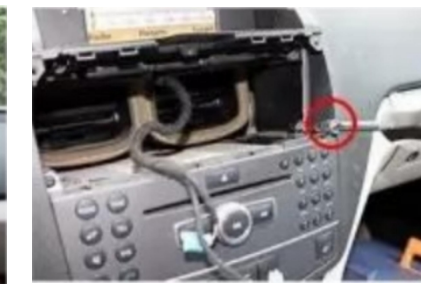
9. Entfernen Sie die Befestigungsschrauben des Original-CD-Players