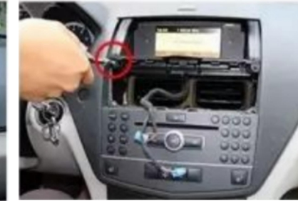
5. Entfernen Sie die Befestigungsschrauben des Original-Autobildschirms.