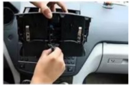
3. Hebeln Sie den Stecker der Klimaanlage heraus und entfernen Sie ihn.