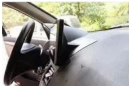
22. Seitenansicht nach dem Laden