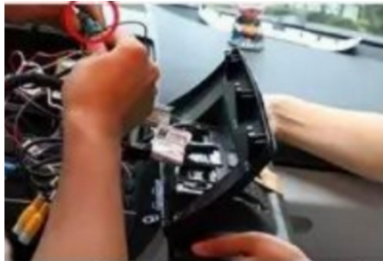
19. Unser Display-Adapter ist mit dem LVDS-Kabel verbunden