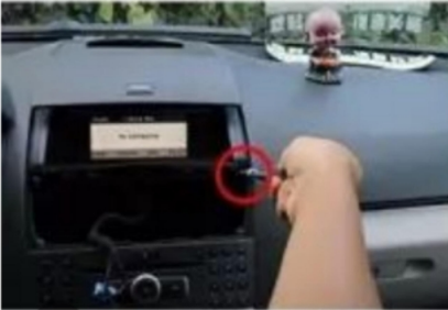
4. Entfernen Sie die Befestigungsschrauben des Original-Autobildschirms