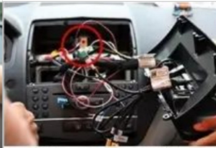
20. Entwurfsskizze nach der Installation der Leitung