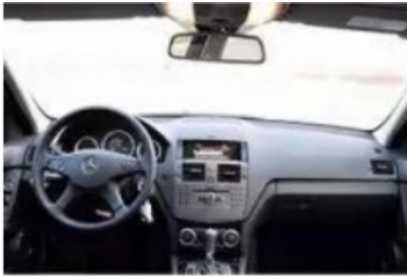
1. Zentralsteuerungsdiagramm des Originalfahrzeugs