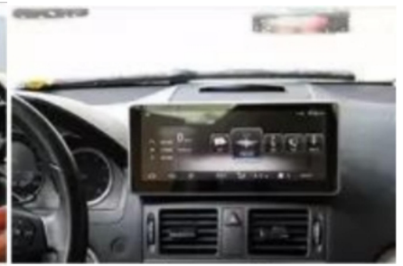
21. Entwurfsskizze nach dem Laden