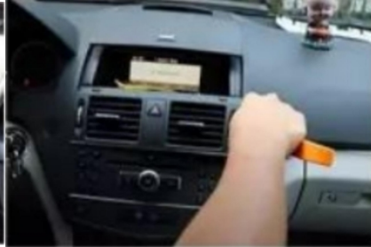
2. Hebeln Sie die Klimaanlageblende des Originalfahrzeugs ab