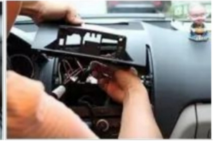
18. Installieren Sie unser spezielles Panel