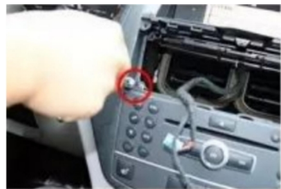
10. Entfernen Sie die Befestigungsschrauben des Original-CD-Players