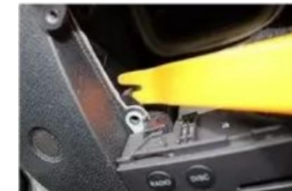
12. Hebeln Sie den CD-Befestigungsstapel des Originalfahrzeugs ab