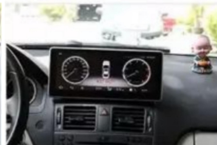
23. Entwurfsskizze nach dem Laden