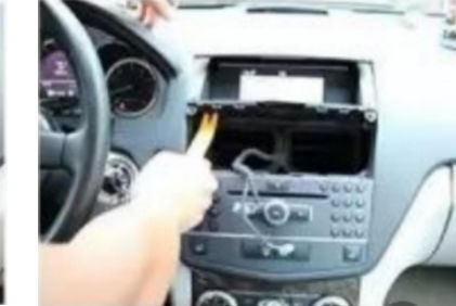
6. Hebeln Sie den Original-Fahrzeugbildschirm ab