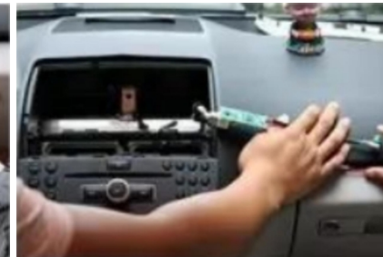
15. Verbindung zwischen dem Stecker des Original-Fahrzeugbildschirms und dem Adapterkabel unseres Unternehmens