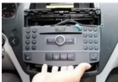
13. Entfernen Sie den Original-CD-Host