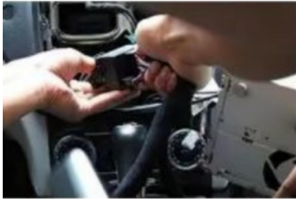
16. Verbindung zwischen dem Original-Motorstecker und unserem Stecker