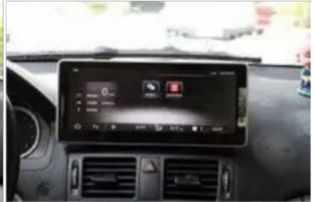
24. Entwurfsskizze nach dem Laden