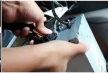
17. Stecken Sie unseren Stecker wieder in den Original-Host